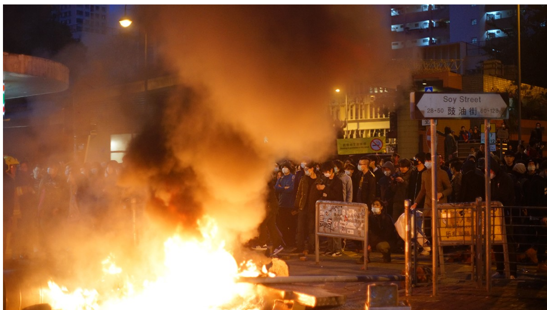
資料圖片：旺角騷亂

2016 年新年夜，發生了旺角騷亂，大部份泛民政黨和公民社會齊聲譴責暴力，是為「割席」事件之最。桑普說：「當時我馬上寫了三篇文章，從法律和政治角度去說，我不相信參加的市民是『鬼』，覺得他們好勇敢；看到交通警開槍，就好憤怒。我認為梁振英想用這件事來打擊本土派，當時在場的人，大部份都是義憤填膺，認為食環不應該大時大節欺負小販。事後睇返都無錯。你在 2020 年再想想，掙磚就好暴力？現在看來當時大眾的反應，就十分荒謬。那一晚出現的東西，是一種臨陣對敵的反應。」